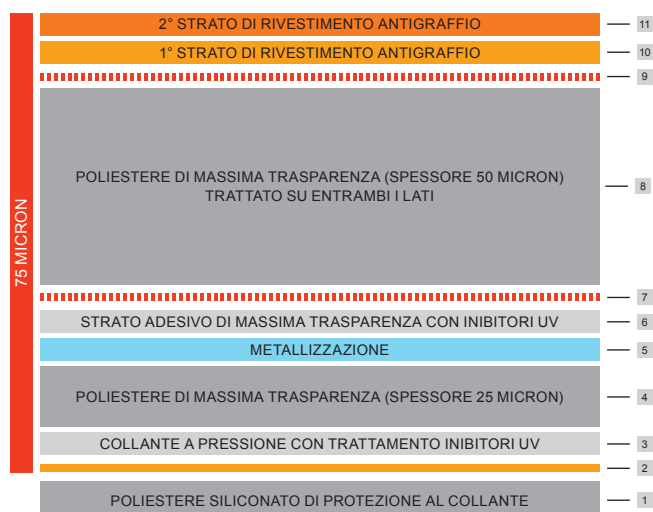
Pellicola Madico EXSR 3mil - 75 micron