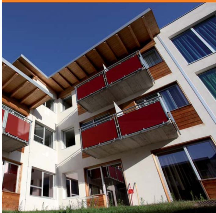
Pellicola antisolare ad alto risparmio energetico ed a lunga durata - Studentato San Barbolomeo, Opera Universitaria di Trento

Con Serisolar il vetro è schermatura solare