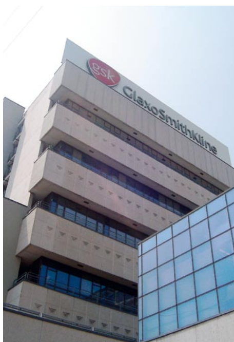
Im ganzen norditalienischen Raum ist das Trientner Unternehmen erfolgreich tätig

Seine Kunden sind Planungsbüros, Techniker, Berater für die Sicherheitsbestimmungen „626“, Glasereien, Facility Manager und Verwalter von privaten und öffentlichen Gebäuden. [X]