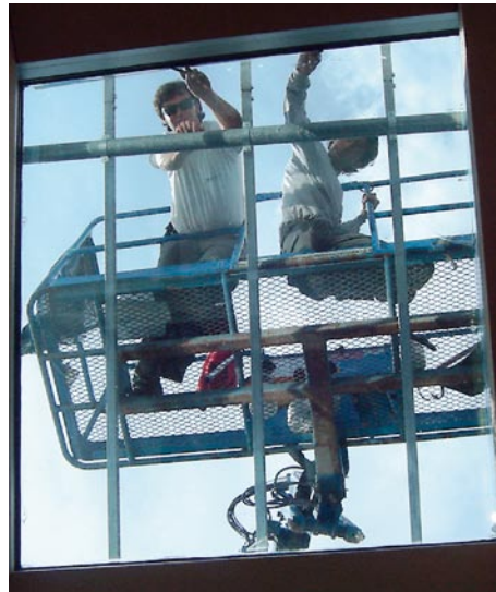
Zwei Details einer Glasfront, bei der Serisolar Sonnenschutzfolien angebracht hat; an den helleren Scheiben fehlt die Folie noch, die dunkleren sind schon bearbeitet

[ Das Unternehmen ] Serisolar ist seit 40 Jahren im Bereich der Klebefolien tätig, seit 10 Jahren vertreibt das Unternehmen aus Gardolo bei Trient mit großem Erfolg die führenden Marken für Glasfolien wie Madico, 3M und Llumar.